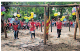
Mit einem Schubs wurden die neuen Schaukeln eingeweiht. AMI

Fries kündigte an, dass der Schulverband 50000 Euro für die Verbesserung der Schulhofsituation der Südensee-Schule bereitgestellt hat. ami